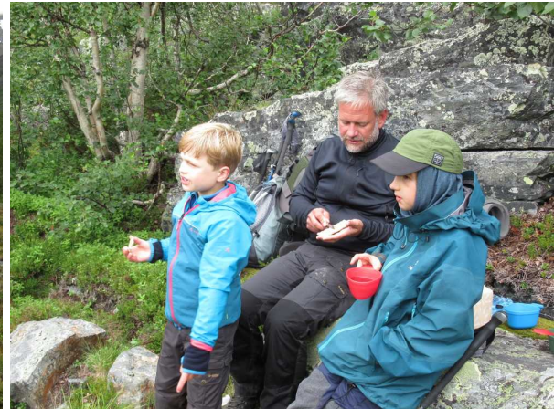
Mittagessen mit Knäckebrot und Marmelade.